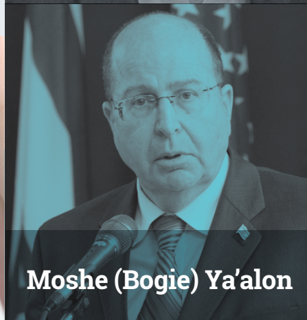
Moshe (Bogie) Ya'alon